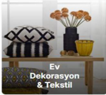
Ev Dekorasyon & Tekstil