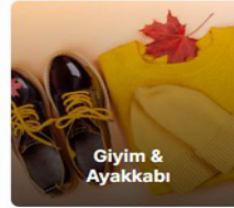
Giyim & Ayakkabı