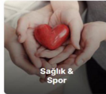
Sağlık & Spor