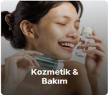
Kozmetik & Bakım