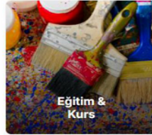
Eğitim & Kurs